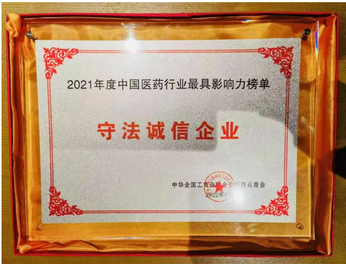
北京盈科瑞创新医药股份有限公司获得2021年度“守法诚信企业”