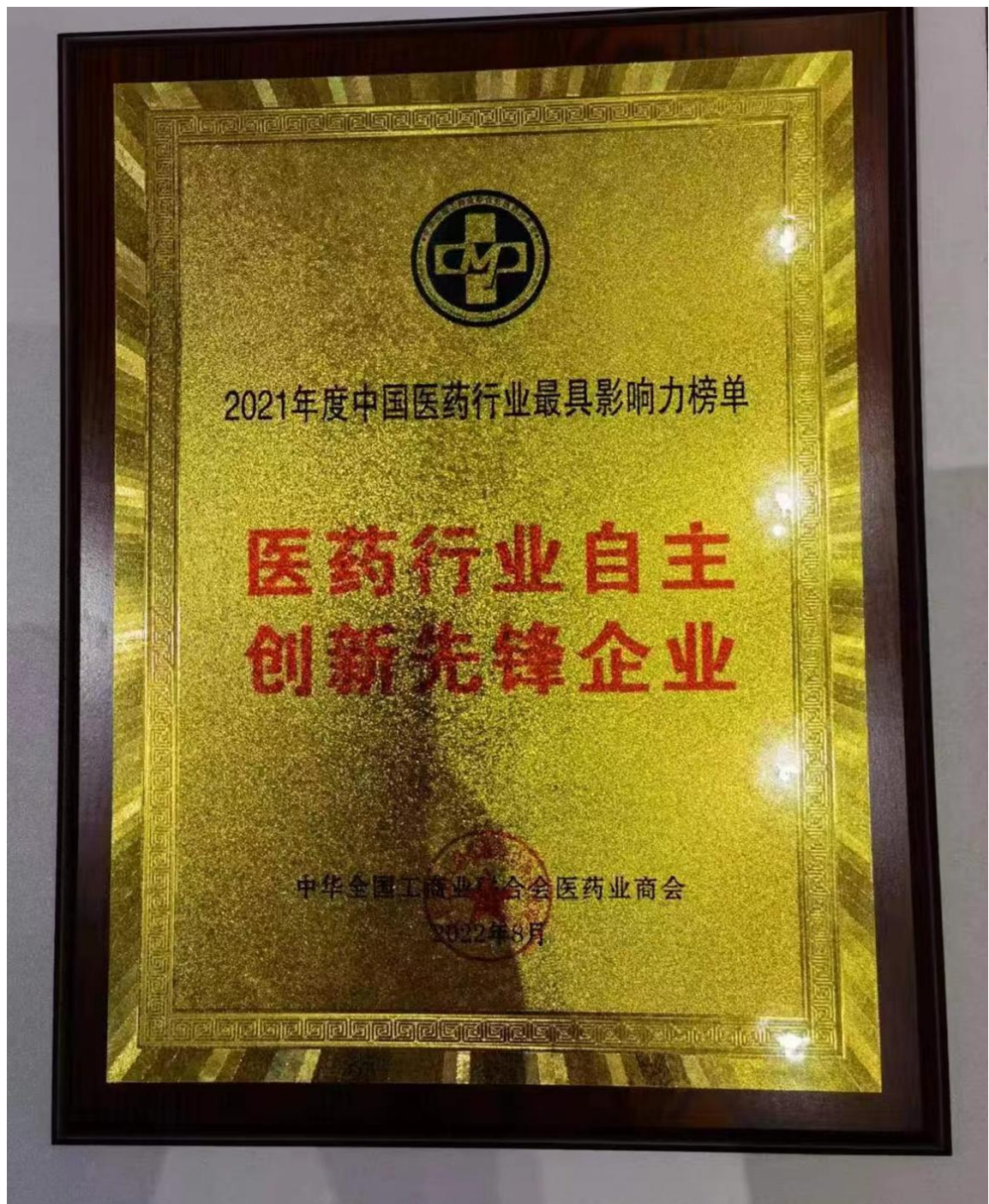
北京盈科瑞创新医药股份有限公司获得2021年度中国医药行业最具影响力榜单医药行业自主创新先锋企业