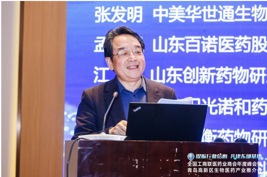
张保献董事长出席会议并宣读增补名单